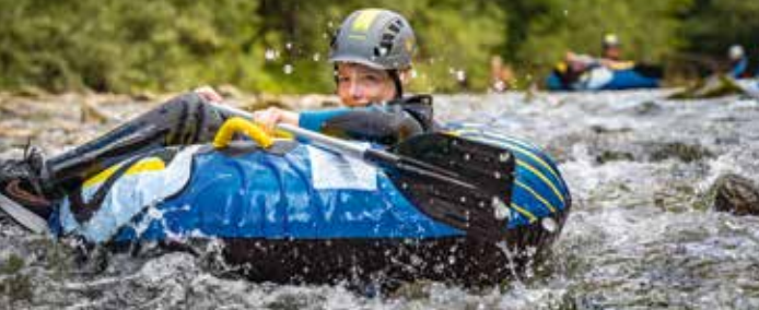
Donnerstag: Tubing Thursday: Tubing

Mit Schlauchreifen (engl. Tube) reiten wir den Fluß hinunter und machen in einer Bucht Pause zum „Gumpenspringen“. Wer schafft die Stromschnelle ohne umzukippen? Wer traut sich vom Felsen in die tiefen Becken zu springen? Bestens ausgerüstet mit Neoprenanzug, Helm und Schwimmweste schafft ihr alle Herausforderungen. Bitte bringt Badesachen und ein zweites Paar Schuhe, die nass werden können, mit. Erst ab 12 Jahren möglich!