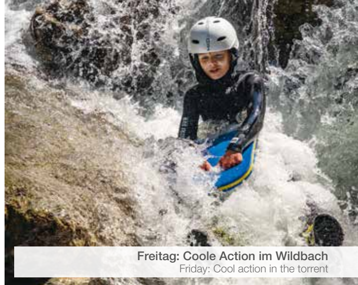
Freitag: Coole Action im Wildbach Friday: Cool action in the torrent

EUR 42,00 inkl. Ausrüstung | EUR 42.00 incl. equipment.